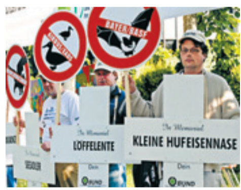
Löffelente und Kleine Hufeisennase – Demonstration in Bonn für den Artenschutz.

Nach Ansicht von Bundesumweltminister Sigmar Gabriel (SPD) muss in den kommenden zwei Wochen hart verhandelt werden, um zu substanziellen Fortschritten zu kommen. In Bonn stehe die UN-Konvention am