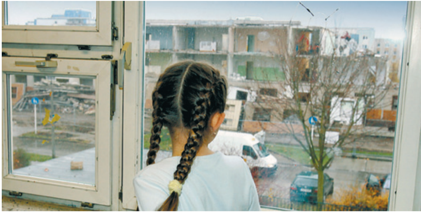
Jedes siebte Kind lebt unterhalb der Armutsgrenze, in Berlin ist es sogar jedes vierte Kind – im Bild ein Schulfeldchen, das in einem Projekt in Berlin-Hellersdorf betreut wird.

Wer ist arm in Deutschland, und wer ist reich? Das lässt sich nicht mit einem Satz beschreiben. Es gibt dafür auch kein absolutes Maß. Die Definition ist kompliziert – und relativ. Der dritte regierungsamtliche „Armuts- und Reichtumsbericht“, aus dem Sozialminister Olaf Scholz (SPD) gestern „Eckdaten und Kernaussagen“ veröffentlicht hat, orientiert sich an Standards der Europäischen Union sowie der Organisation für wirtschaftliche Zusammenarbeit und Entwicklung (OSZE). Demnach beginnt das Armutsrisiko bei Einkünften, die höchstens 60 Prozent des sogenannten mittleren Nettoäquivalenzeinkommens betragen. Darunter versteht man das Nettoeinkommen einer Person, die genau in der Mitte stünde, wenn die gesamte Bevölkerung sich gestaffelt nach ihrem Einkommen in einer langen Reihe aufstellen würde. Diese Größe ist nicht mit dem Durchschnittseinkommen zu verwechseln. Bei Haushalten mit mehreren Personen wird das gesamte Haushaltseinkommen nicht etwa durch die Zahl der Haushaltsmitglieder geteilt, sondern durch einen Faktor, der etwa Kinder anders berücksichtigt als Erwachsene. Nach dieser Definition beginnt das Armutsrisiko für Alleinstehende bei 781 Euro netto im Monat. Als reich gelten Singles, die