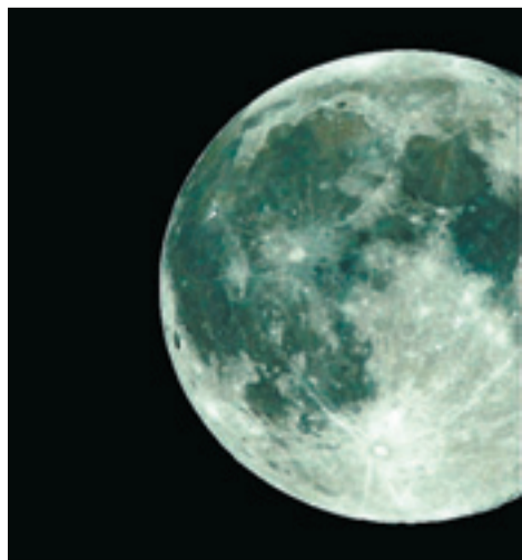
Der Mond, das neue Objekt der Begierde vieler Wissenschaftler

Die Entscheidung über eine bemannte Mission ist den zuständigen Ministern der Esa-Mitgliedsstaaten vorbehalten. Sie tagen das nächste Mal im November in Den Haag. Sollte das ATV ausgebaut werden, müssten sich die Esa-Staaten auf einen Kostenschlüssel einigen. Deutschland trägt innerhalb der Esa normalerweise 21,85 Prozent der Kosten. Beim Weltraumlabor Columbus für die Raumstation ISS hat sich Deutschland jedoch mit gut 40 Prozent beteiligt.